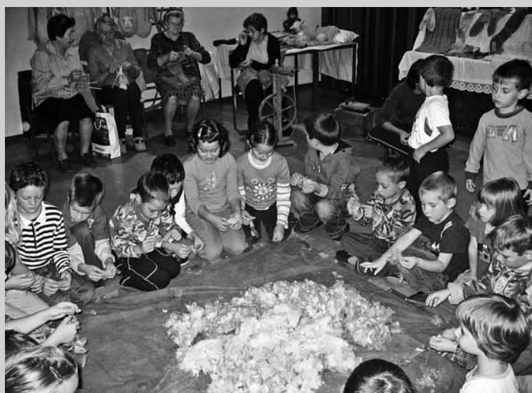
OTROCI OŠ SMAST so se na predstavitvi preizkusili v cufanju volne .

ekološkega delovanja nasploh. Projekt je izziv in priložnost, da pokažemo bolj odgovoren odnos do narave, preteklosti in kulturne dediščine. V okviru letošnjega osrednjega ekoprojekta Ekokmetijstvo smo z učenci pripravili predstavitev Od ovce do volnena izdelka . Že pred glavnim dogodkom smo skupaj oblikovali predstavitvene plakate o ovcah in njihovih proizvodih ter razstavo