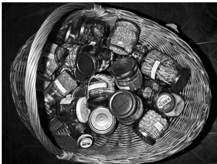
LASTNA SEMENSKA HRAMBA – Vedno več ljudi se zaveda pomena čistih živih semen. Z njihovo hrambo lahko prihodnje leto dobimo nov pridelek, medtem ko hibridna in GS-semena, ki vsebujejo tako imenovani terminatorski gen, rodijo le enkrat. Takim semenom zato pravimo tudi mrtva semena.

N a Zemlji so skozi evolucijo nastale pestre oblike življenja rastlinskih in živalskih vrst. Narava je zanje skozi desetisoče let ustvarila značilne strukturne meje, ki uravnavajo prenos genov z ene vrste na drugo – brez tega vrste ne bi mogle preživeti in se razmnoževati. Genska tehnologija pa omogoča prenos genov brez omejitev, oblikovanih skozi evolucijo, in z izjemno hitrostjo spreminjanja lastnosti organizmov. Nasprotniki gensko spremenjenih organizmov (GSO) opozarjajo, da je hitrost, s katero znanstveniki spreminjajo organizme, obratno sorazmerna s časom in celovitostjo, ki jo namenjajo preizkušanju tako spremenjenih organizmov. Na trg zato prihajajo nezanesljiva in nepreizkušena semena.