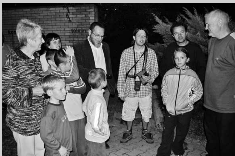
OB EVROPSKI NOČI NETOPIRJEV je NAC Tolmin v sodelovanju s Slovenskim društvom za proučevanje in varstvo netopirjev organiziral predavanje in delavnico o teh skrivnostnih ponočnjakih.

Spomladi, ko se ozračje ogreje, se netopirji postopoma preselijo iz jam na podstrešja. Samice se zberejo v kolonije in skotijo mladiče, ki jih dojijo in nosijo s seboj na večerni lov za hrano, vse dokler ti niso samostojni. Porodniških kolonij ne smemo obiskovati, če nismo za to ustrezno usposobljeni. S svojim obiskom lahko kolonijo vznemirimo in mladiči padejo na tla, kjer poginejo. Jeseni so že